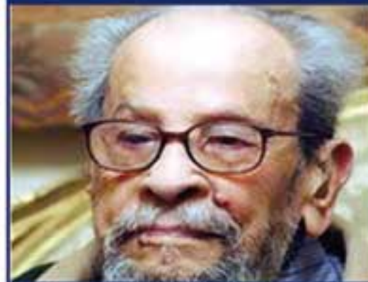
NAGUIB MAHFOUZ, écrivain égyptien, prix Nobel de littérature en 1988

«La vie est sage de nous tromper, car si elle nous disait dès le début ce qu'elle nous réserve, nous refuserions de naître».