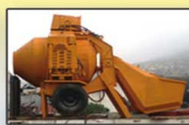
Bétonnière de chantier