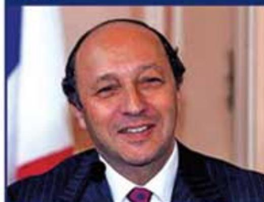
Laurent Fabius, Ministre français des affaires étrangères.

« Tuer des journalistes c'est commettre un crime contre la liberté d'informer et de s'informer ».