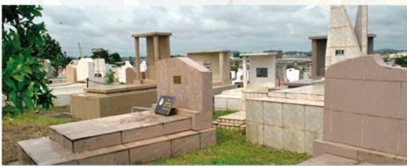
Une image d'un cimetière correct et civilisé