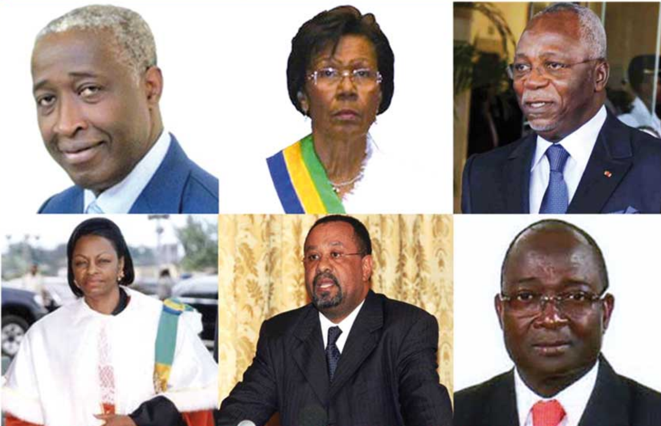
Les tenants du système PDG. De la Rénovation renouée et concertée (avec le régime de parti unique et la fameuse démocratie pluripartite) à l'Emergence trompe-l'oeil: Blanc bonnet, bonnet blanc?

«Comme il serait louable chez un prince de tenir sa parole et de vivre avec droiture et non avec tromperie» déclarait un penseur politique. Au sens absolu, si la politique est l'art de gouverner la cité en vue d'attendre ce que l'on considère comme la fin suprême de la société, c'est à dire son bonheur, celle-ci est davantage la définition et la mise en oeuvre de moyens pour réaliser certains objectifs déterminés dans des domaines précis (politique de l'emploi, politique de la santé...). D'où la réflexion et le choix sur la méthode de gouvernement et la lutte pour la conquête ou l'exercice du pouvoir