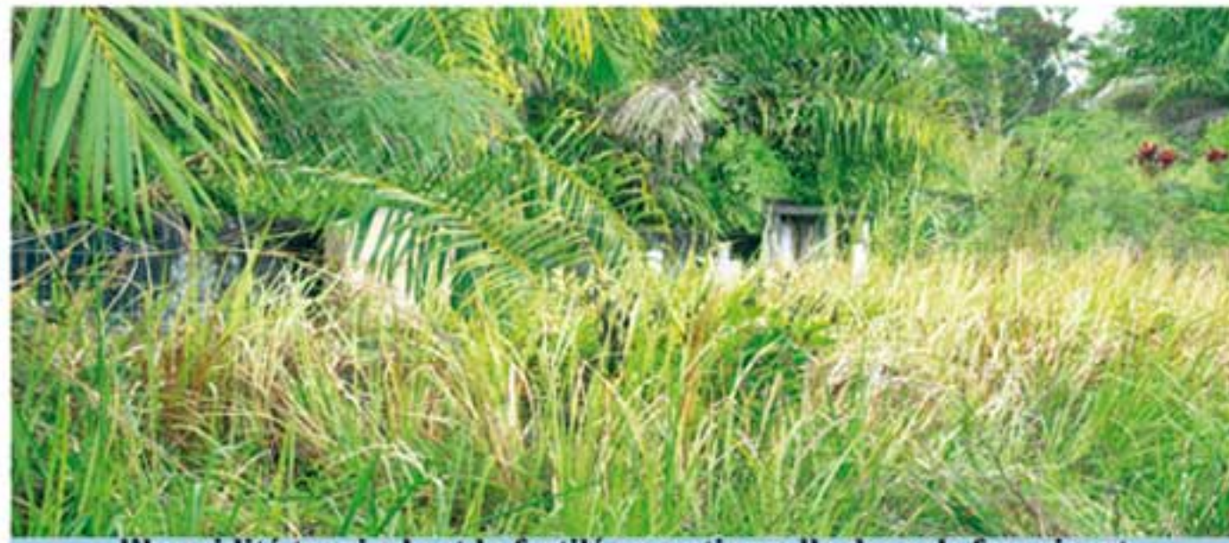
l'humidité tropicale et la fertilité exceptionnelle des sols favorisant la poussée d'herbes sauvages dans les cimetières