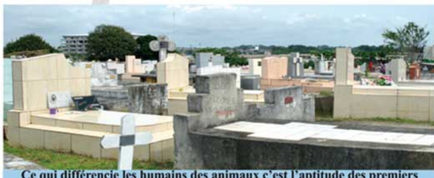
Ce qui différencie les humains des animaux c'est l'aptitude des premiers à offrir une sépulture décente aux défunts.

Reportage de Dr Bernard EKOME et Steve MOUNGUENGUI