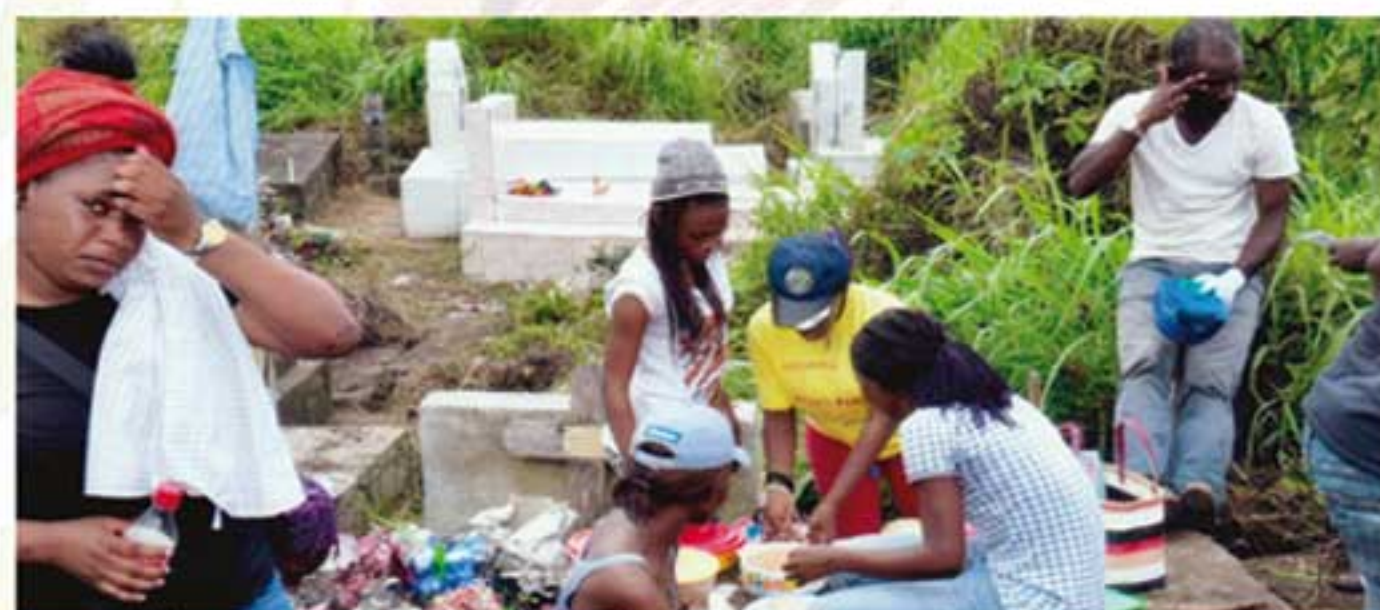
Moment de communion et de retrouvailles autour de la sépulture d'un parent disparu