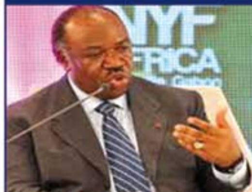
Ali BONGO, Président de la République gabonaise.

« Les fondamentaux de l'économie gabonaise émettent des signaux favorables à l'investissement et à la prise de risque »