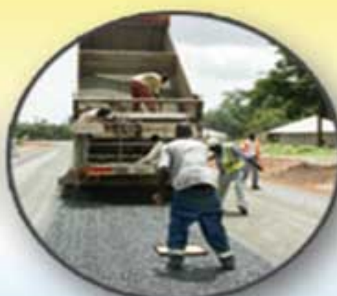
Aménagement de chaussées