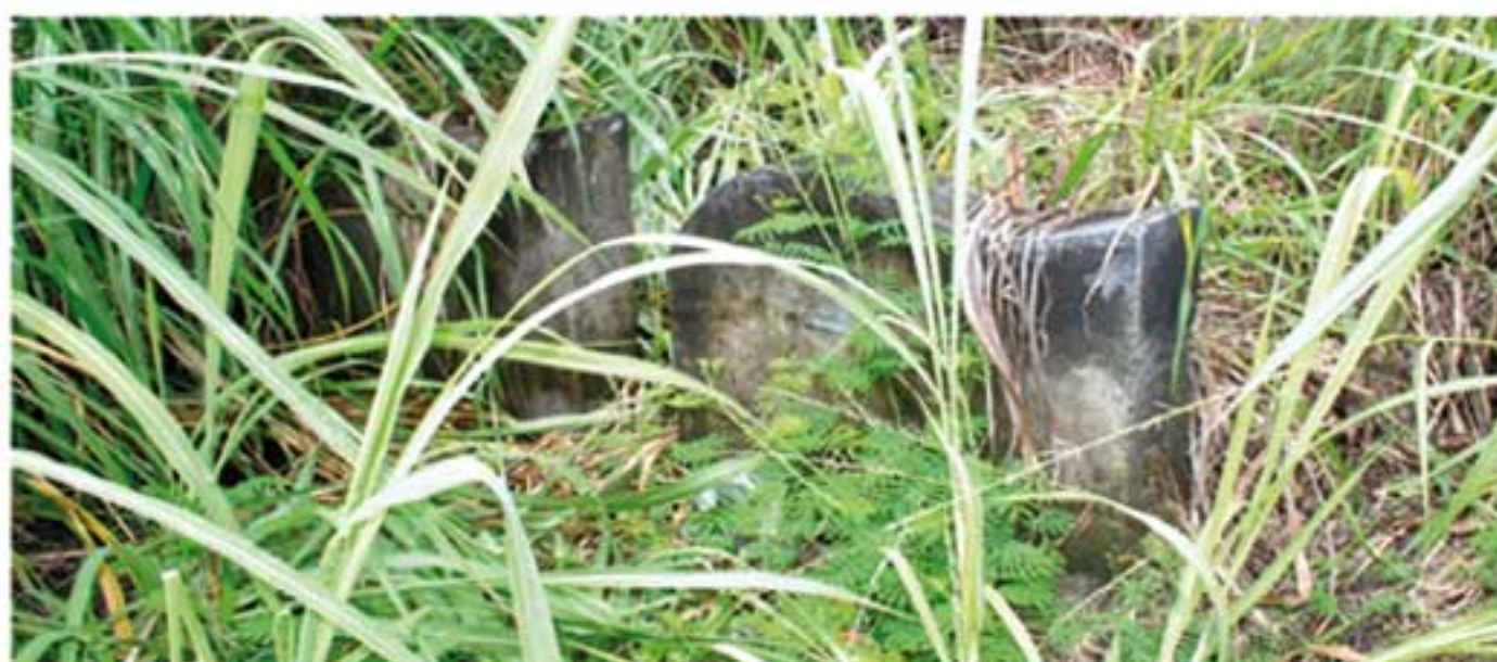
Une tombe colonisée par les herbes sauvages et repère des reptiles