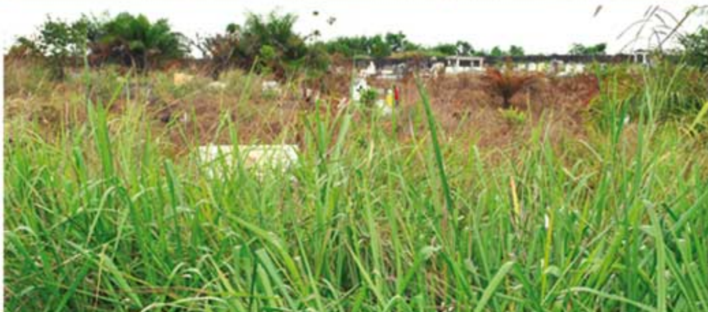
Un contraste entre la vitalité de la végétation luxuriante et le repos des défunts

La capitale gabonaise qui héberge près de la moitié de la population du pays n'offre pas à ses habitants un cimetière digne d'un émirat équatorial. Au contraire, les espaces prévus pour le repos des défunts sont accablés de nombreux manques : invasion des hautes herbes, insécurité des tombes anonymes, ce qui expose les parents à rechercher laborieusement et vainement la sépulture de l'Être cher exposé à l'insalubrité, aux effets des inondations, intempéries et aux profaneurs de tombes surtout en période électorale où le fétichisme par crimes rituels interposés renaît souvent de ses cendres.