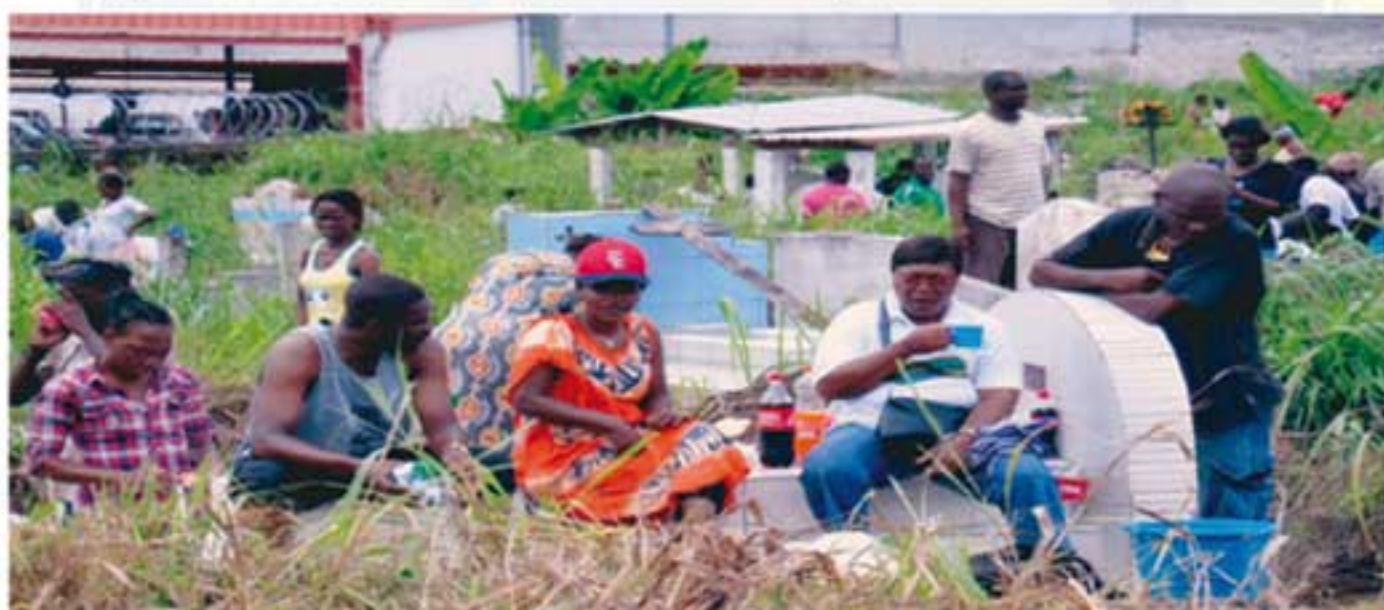
Que la lutte contre les hautes herbes dans un cimetière public est épuisante!