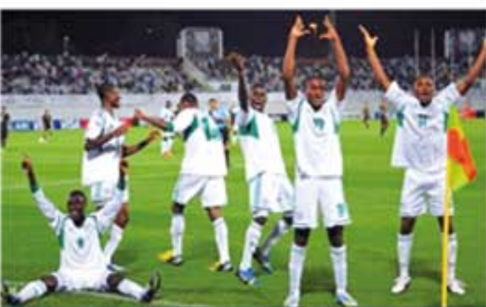
Les joueurs nigériens exultant de joie