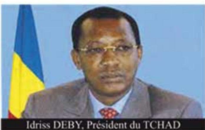
Idriss DEBY, Président du TCHAD

Après le Gabon en 2007 et le Cameroun en 2010, le Tchad est le troisième pays de la zone CEMAC à lancer un emprunt obligataire. Pour ce faire, le ministre de l'Economie du Tchad avait effectué une visite à Libreville le 1er juin dernier pour présenter l'emprunt obligataire de 100 milliards de FCFA qui correspond à 10 millions d'obligations et qui place le prix de la souscription à 10000 fefa. Lancé le 24 mai dernier dans les six pays de la CEMAC (Gabon, Congo, Cameroun, Tchad, Guinée équatoriale, République