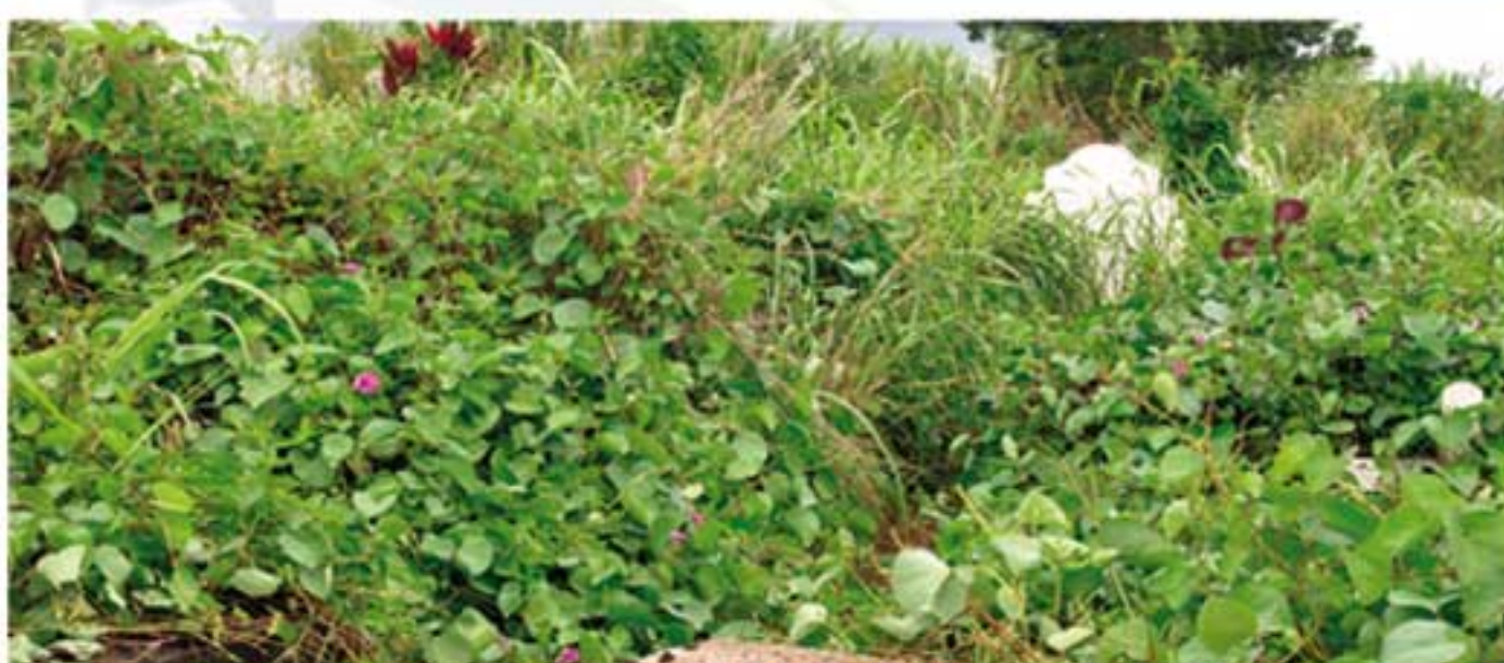
Qui pourrait soupçonner qu'ici gît un Homme créé à l'image et à la ressemblance de Dieu