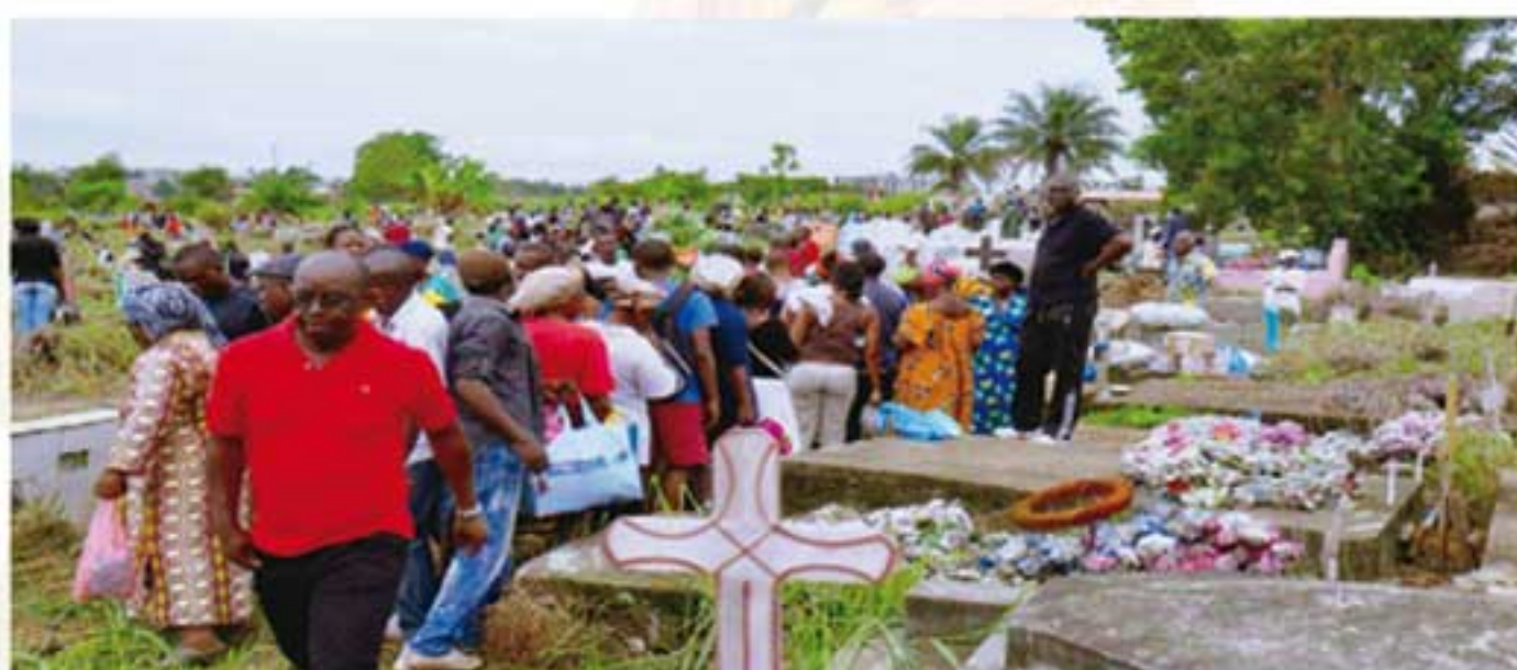
Une foule bigarrée circulant laborieusement dans un cimetière non-civilisé