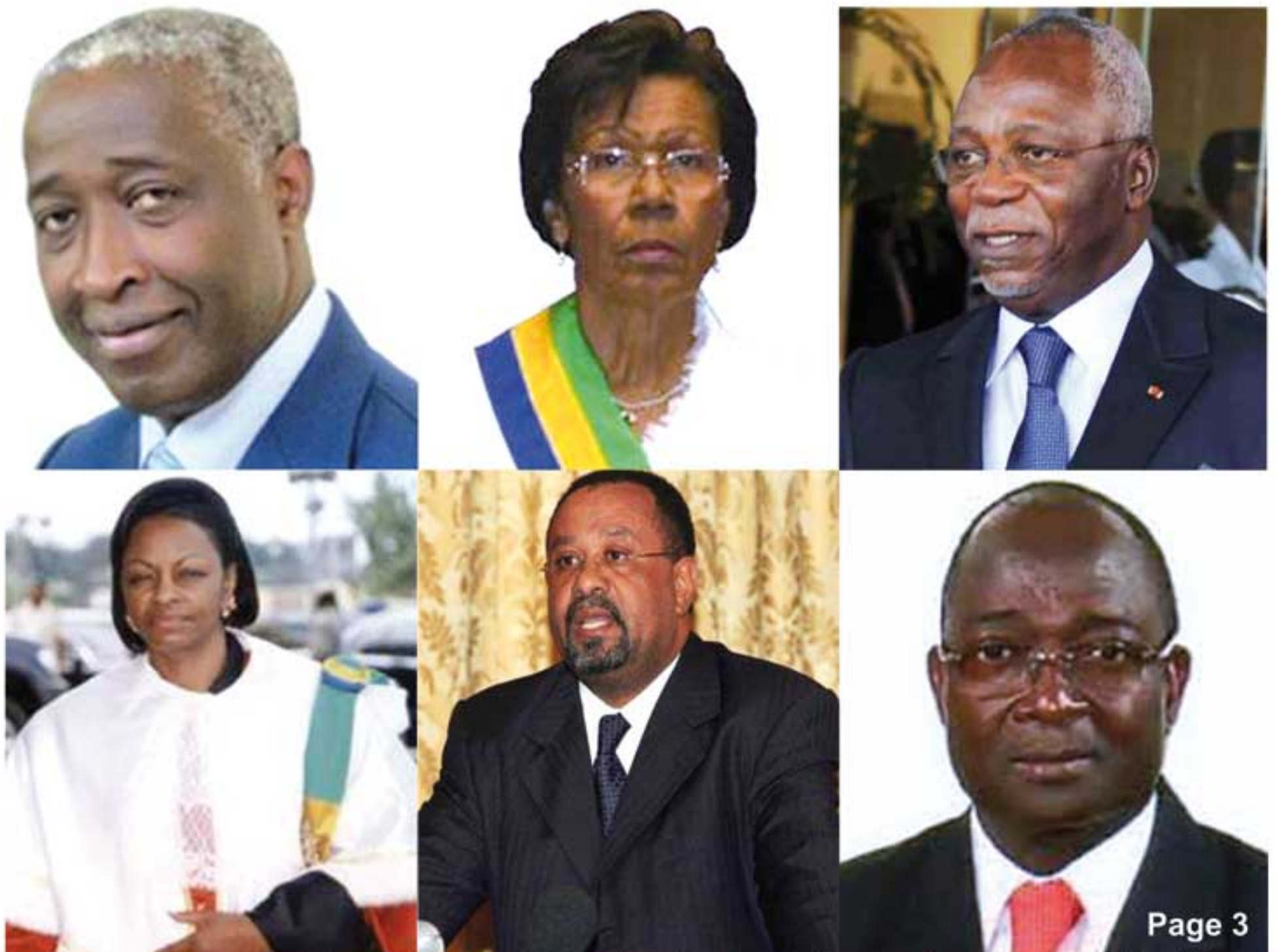
Les tenants du système PDG. De la Rénovation rénovée et concertée (avec le régime de parti unique et la fameuse démocratie multipartite) à l'Émergence trompe-l'oeil: Blanc bonnet, bonnet blanc?