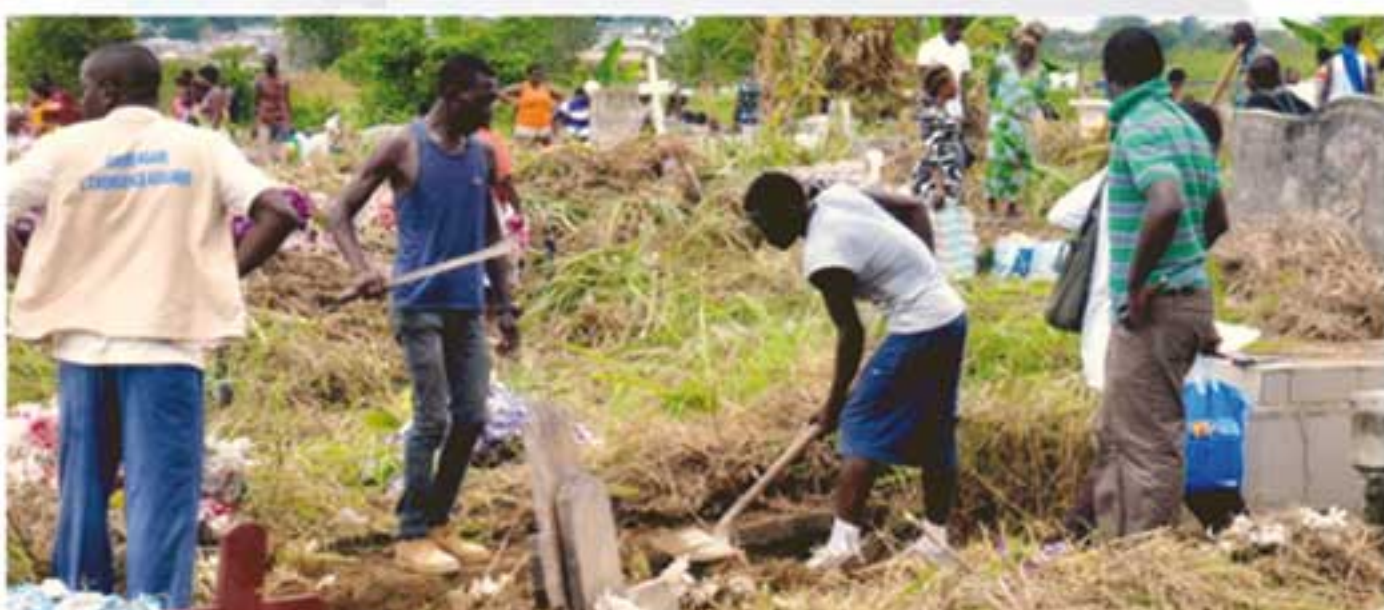
Des citoyens privés déterminés à redonner un aspect convenable à un cimetière